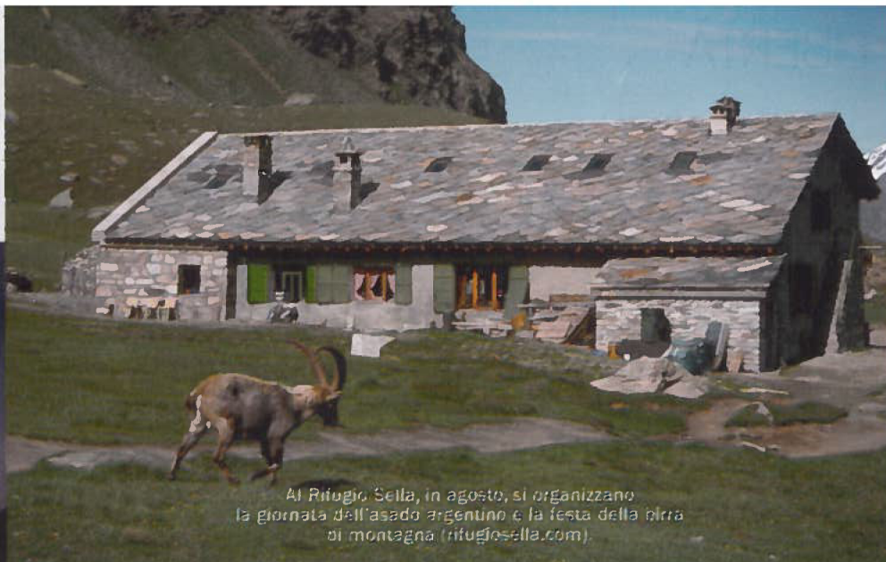
Al Rifugio Sella, in agosto, si organizzano la giornata dell'asado argentino e la festa della birra di montagna (rifugiosella.com).