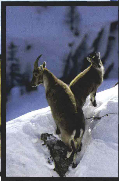
A spasso con le racchette da neve in Valgrisenche. A lato, una lince e una femmina di stambecco con il piccolo.