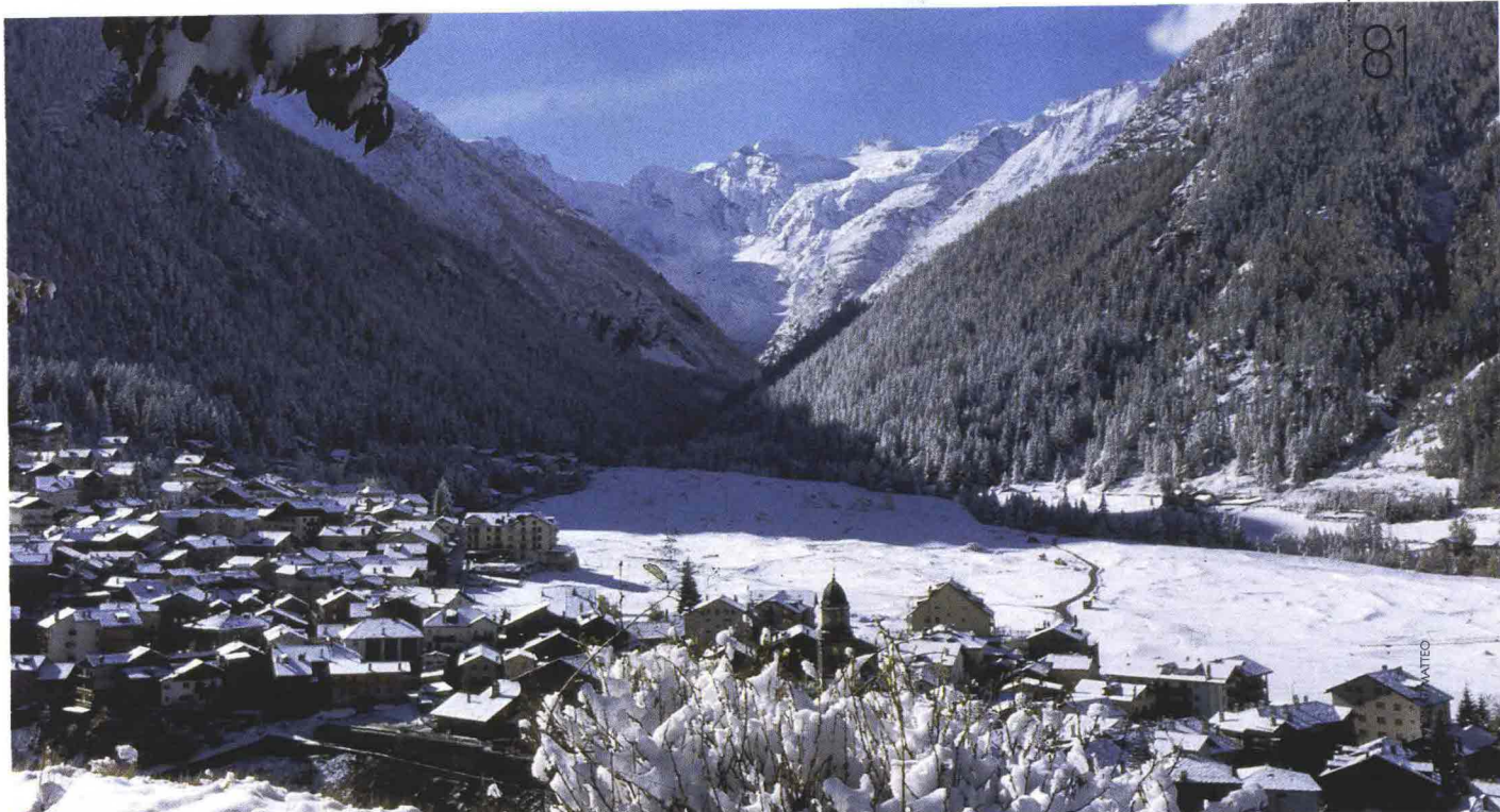
Il paese di Cogne si trova all'imbocco della Valnontey, ed è adagiato ai piedi del massiccio del Gran Paradiso.